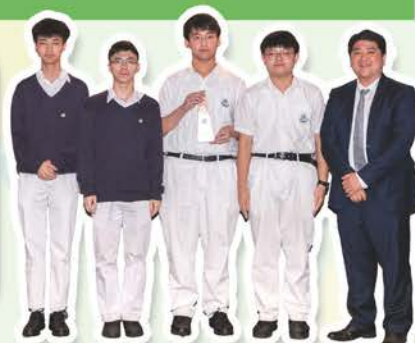
本校同學以作品「褥瘡？使乜驚！」奪得 全港中學生創科設計大賽2025 優異獎