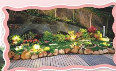
平台花園太陽能灑水系統及光感照明裝置