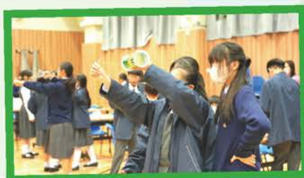
中一級：旋轉杯滑翔機工作坊／挑戰賽

本學年的STEAM活動主要分為校內STEAM Friday動手活動、跨科STEAM專題習作及校外STEAM比賽。中一至三全級同學均以小組協作形式進行多個STEAM動手活動／比賽及進行跨學科STEAM專題習作，主題內容緊扣科學、數學、電腦、物理及視藝各科的教學內容，除讓同學能學以致用外，過程更能促進同學審辨思維的能力、提升創意表現、鼓勵參與及協作，另外同學亦需進行自主學習，尋找解決問題的方案，並將視藝技巧及創意加入各成品之中。