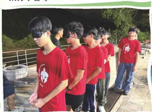
中三級「擁抱成長」夏令營 黑暗中的對話