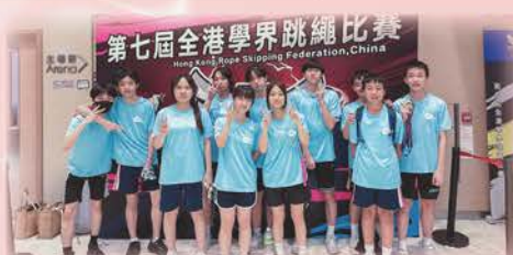
第七屆全港學界跳繩比賽