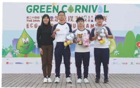
第24屆環保創意模型設計比賽