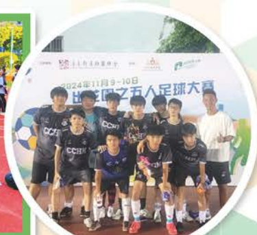
足球校隊——出花園五人足球大賽