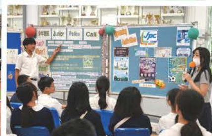
少年警訊攤位活動