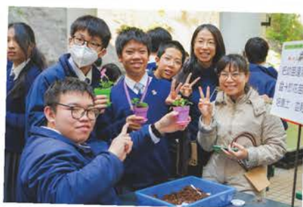
環境及園藝學會——「一人一花·傳感恩」活動