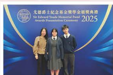
尤德爵士紀念基金獎學金 頒獎禮2025