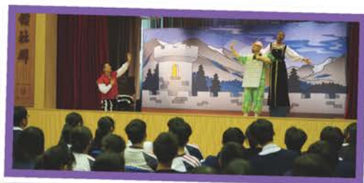
高中英語話劇欣賞