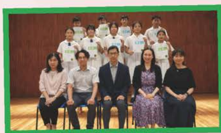
香港學校朗誦節(普通話)