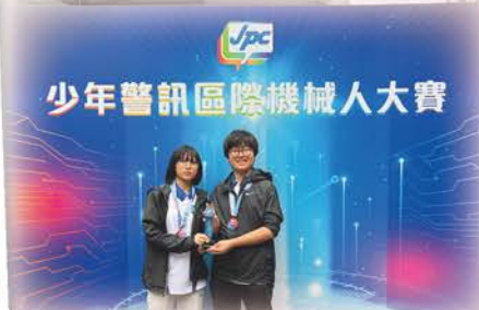
少年警訊區際機械人大賽