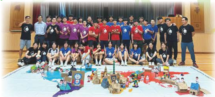
中三級 攜手共建「文理城」

活動包括：不同形式的體驗式學習活動、自我認識小組活動、目標訂立活動、歷奇活動、音樂分享會等。