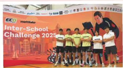
學界電競單車挑戰賽2025