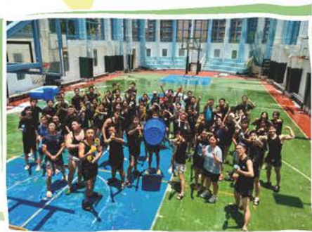
「大學生活體驗營」水戰活動