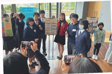
第三屆科夢盃全港中小學科學海報大賽