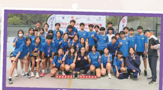
中學校際越野比賽