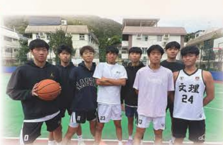
動樂無限三人籃球賽 2024