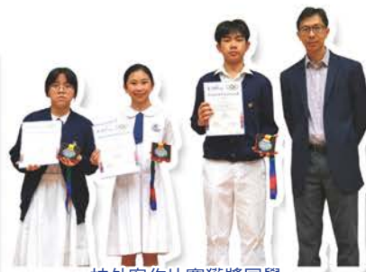
校外寫作比賽獲獎同學