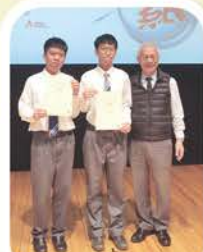
2025趣味科學比賽 『低年級組挑戰組』 一等獎