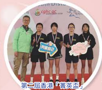
第二屆香港「菁英盃」 青少年長跑大賽