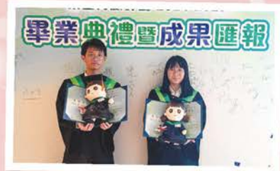
東區青藤計劃畢業禮