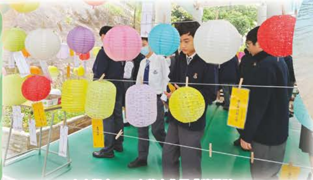
中文學會——中華文化周「猜燈謎」

英文學會、中文學會 數學學會、國民教育學會 STEAM創客學會、 普通話學會、地理學會 電腦學會、中文演辯學會 時事學會