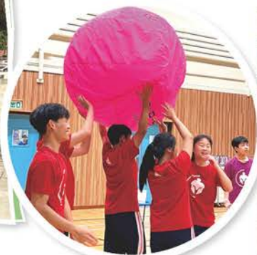
中三級全民造GOAL 目標訂立活動