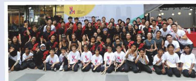
馬來西亞鼓樂之旅