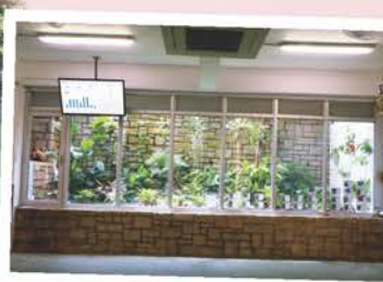
智能溫室及溫室環境實時監察系統