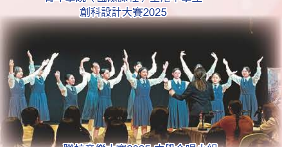
聯校音樂大賽2025-中學合唱小組