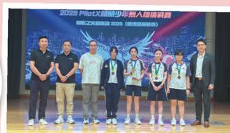
PilotX領航少年編隊無人機挑戰賽