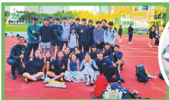
田徑隊——中學校際田徑比賽

籃球校隊（男／女）、 乒乓球班／校隊（男／女）、 足球校隊、羽毛球校隊、 田徑隊、地壺球隊、 花式跳繩隊、舞蹈校隊