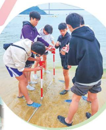
地理學會——深井考察 海岸地貌研習