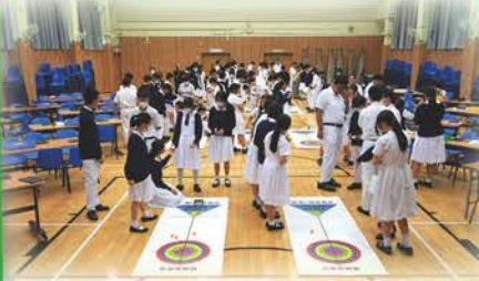
中二級：機械地壘球工作坊／挑戰賽