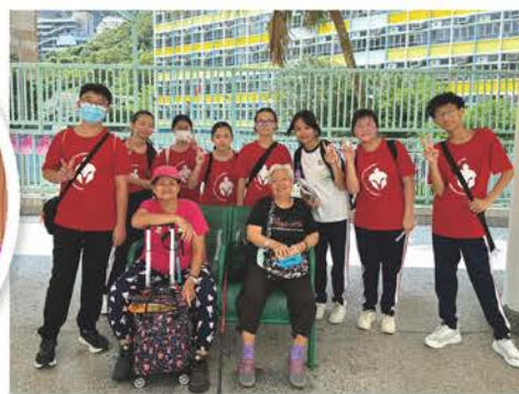
中二級成長日營 市內遊蹤