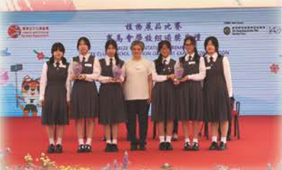
香港花卉展覽2025植物展品比賽 本校獲三項冠軍、三項亞軍及 兩項季軍

我校推動家長與子女攜手參與綠化活動，舉辦了「一人一花·傳感恩」、新春水仙種植工作坊及水仙攝影比賽，透過家校合作共同建立綠色生活。