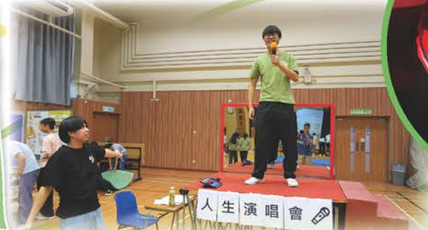
「我是誰」模擬人生活動