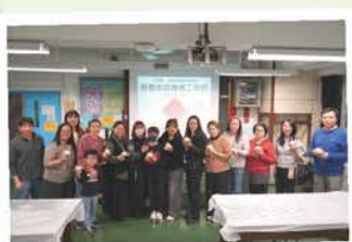
家長親子新春水仙種植工作坊