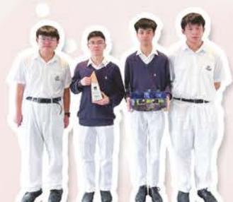
青年學院(國際課程)全港中學生 創科設計大賽2025