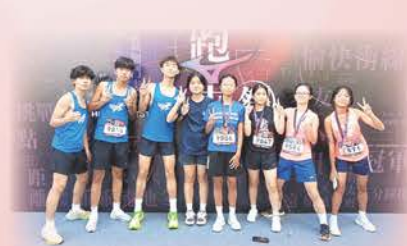
美津濃香港跑步祭 2024