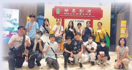
中華文化節「華夏創演MO x e樂團音樂會」

中一同學可於中二及中三級時繼續參加課餘舉辦的樂器興趣班及合奏訓練，繼續提升演奏技巧。學校會提供校外表演機會讓同學發揮所長，同時鼓勵表現優異的同學參加比賽，展示實力。