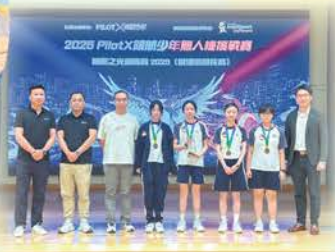
PilotX領航少年無人機挑戰賽 智影之光2025季軍

校外STEAM比賽方面，中一至中五超過100人次的精英亦代表學校參加不同的全港性比賽，除了讓同學發揮潛能，擴闊眼界外，他們出色的表現亦讓我校屢獲獎項。