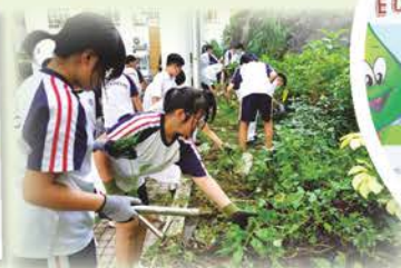
綠化校園隊合力維護 校園的綠化設施