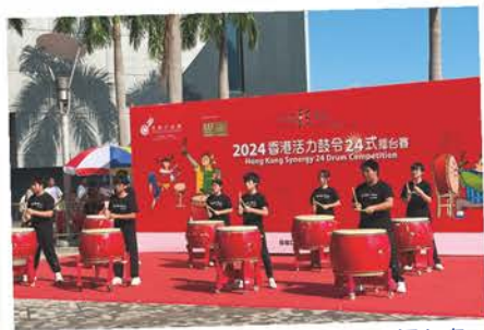
鼓藝團——2024香港活力鼓令24式擂台賽