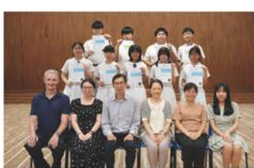
朗誦比賽獲獎同學