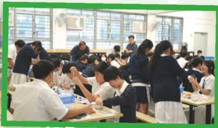
中三級：STEAM三項鐵人賽 同學分組進行科學、電腦及數學的挑戰。