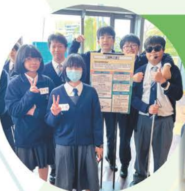
第三屆科夢盃全港 中小學生科學海報大賽 中學組冠軍 作品：《啟眸之鏡》

校外STEAM比賽方面，中一至中五超過100人次的精英亦代表學校參加不同的全港性比賽，除了讓同學發揮潛能，擴闊眼界外，他們出色的表現亦讓我校屢獲獎項。