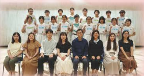
香港學校朗誦節（粵語）