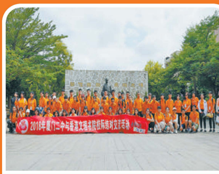
厦门二中与香港文理书院学生在归来堂前合影。