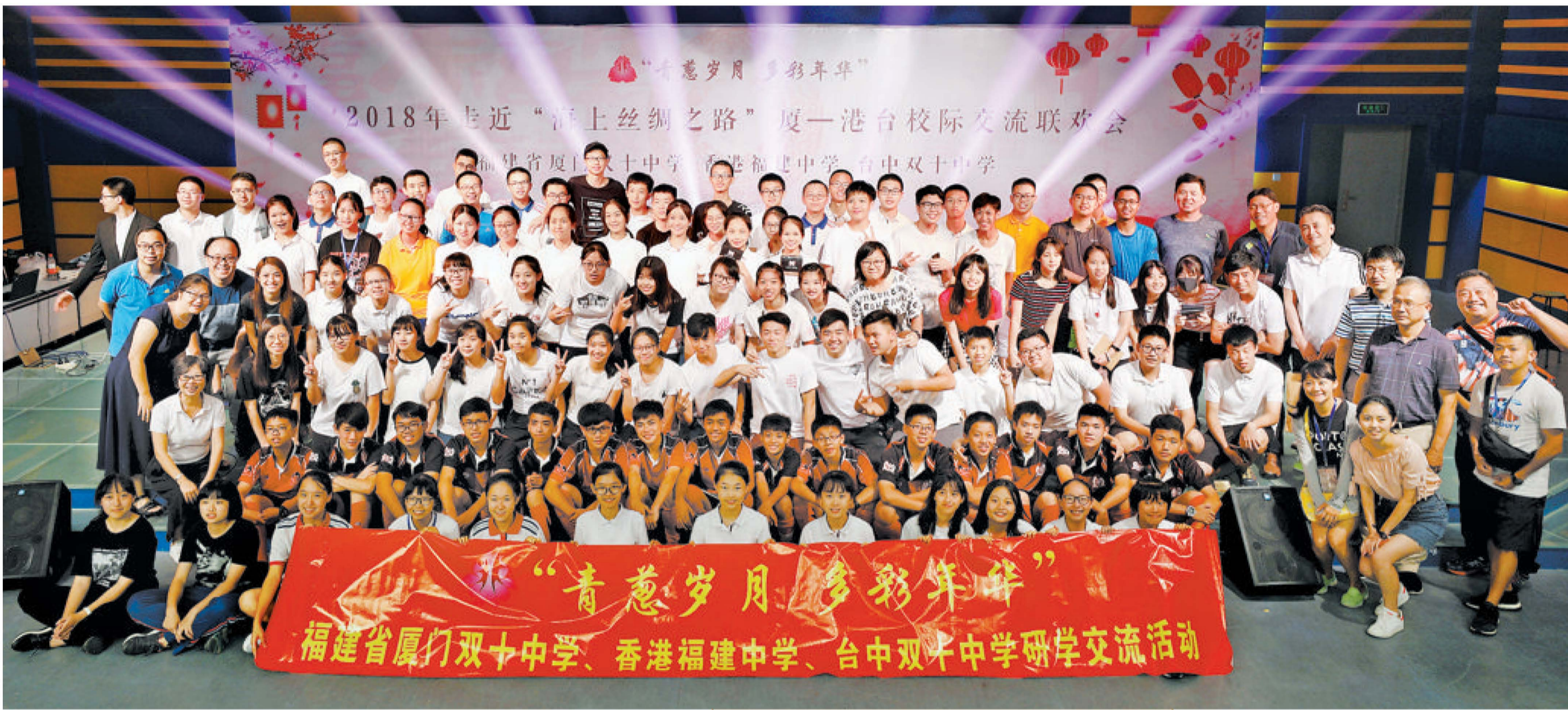
“青葱岁月 多彩年华”福建省厦门双十中学、香港福建中学、台中双十中学研学交流活动

“开阔了眼界,收获满满,更加真切感受到中华文化博大精深与内地改革开放发展成就。”和厦门的小伙伴们同吃、同住、同行,感觉太好了。“我们要和厦门的朋友们说再见,我会想念这里,我相信谁都会……怀着陌生和好奇心来到厦门的港澳台学生,每天都会写下心得体会,或长或短的文字,流露出他们对结对交流活动的喜爱与依依不舍。友谊、亲情的种子,已经播种到他们心中,慢慢生根。