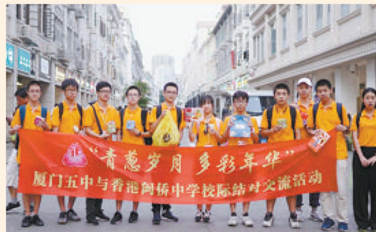
▲厦门五中与香港闽侨中学学生在中山路寻找厦门伴手礼。