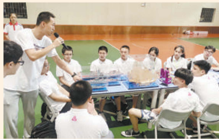
▲厦门五中老师为香港闽侨中学学生介绍航模知识。