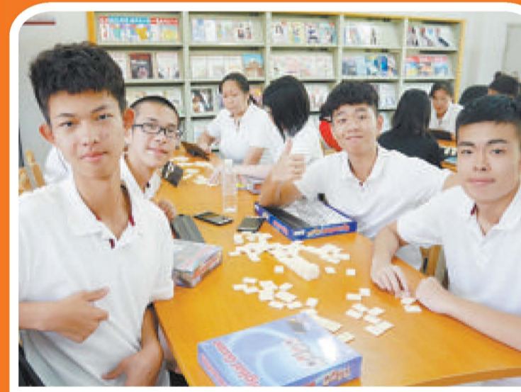
厦门二中与香港文理书院学生进行魔力桥竞赛。