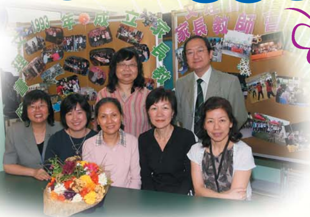
本屆的家教會委員於展板前合照留念

於開放日當天讓我深切體會到文理書院的師生關係融洽，正由於師生們的通力合作，才能把開放日籌辦得有聲有色。家教會的委員亦盡一分綿力設置小食攤位，發揮家校合作的精神。不少舊生亦回校參觀。各位前來參與開放日的來賓看到了這些多元化的節目，都感到很雀躍。我也心想孩子能來到文理書院就讀，真的十分安心。