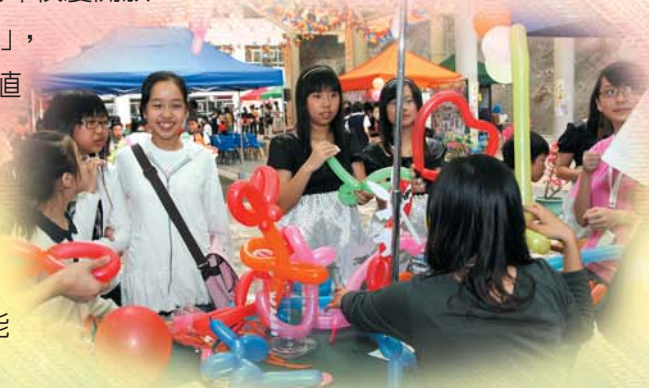
開放日攤位遊戲—扭扭氣球